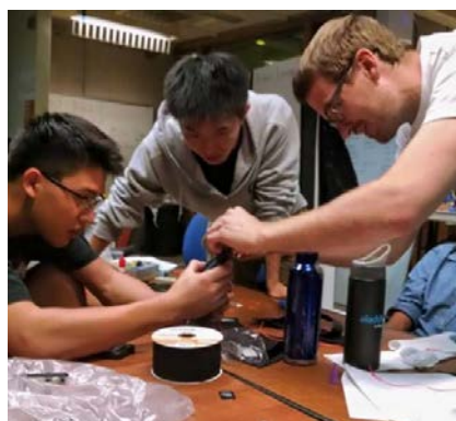
Tendon Glove のコンセプト図（左、[1]より引用）、EnableTech での作業風景（右）

[1] Tendon Glove Group の取り組みについて： http://tendonglove.blogspot.com/